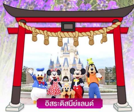
อิสระ-ดิสนีย์แลนด์