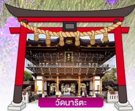
วัดนาริตะ