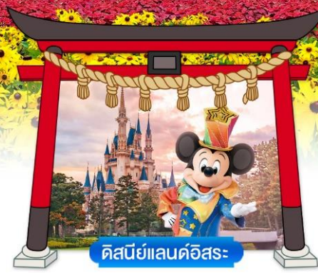
ดิสนีย์แลนด์อิสระ