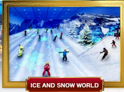
ICE AND SNOW WORLD