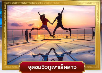
จุดชมวิวกูเงาเจ็ดดาว