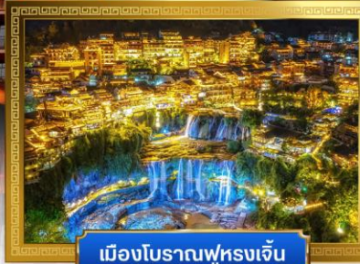
เมืองโบราณฟูหลงเจิ้น