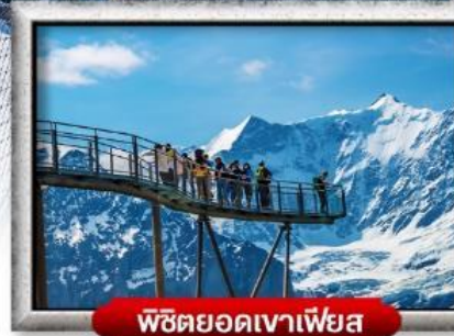
พิชิตยอดเขาเฟียส