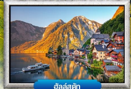
อัลลส์ตัท