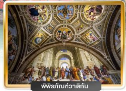
พิพิธภัณฑท์วาติกัน