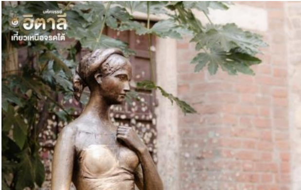
เดียวกัน

(โรงแรมที่ระบุในรายการทัวร์เป็นเพียงโรงแรมที่นำเสนอเบื้องต้นเท่านั้น ซึ่งอาจมีการเปลี่ยนแปลงแต่โรงแรมที่เข้าพักจะเป็นโรงแรมระดับเทียบเท่ากัน โดยจะแจ้งพร้อมใบนัดหมาย 5-7 วันก่อนการเดินทางและของสงวนสิทธิ์ในการปรับเปลี่ยนที่พักไปเมืองใกล้เคียงในกรณีที่มีเหตุแพร่หรือเทศกาล)