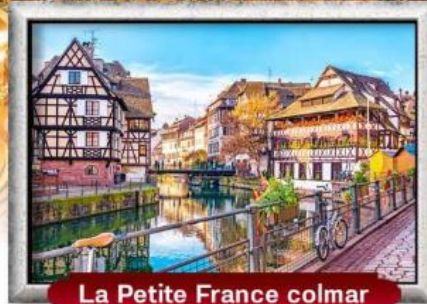
La Petite France colmar

บินทรู สายการบิน Full Service | พิเศษ! หอยแอสคาโก้