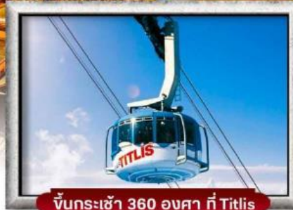
ขึ้นกระเช้า 360 องศา ที่ Titlis