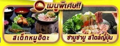
สเต็กหมูฮิดะ