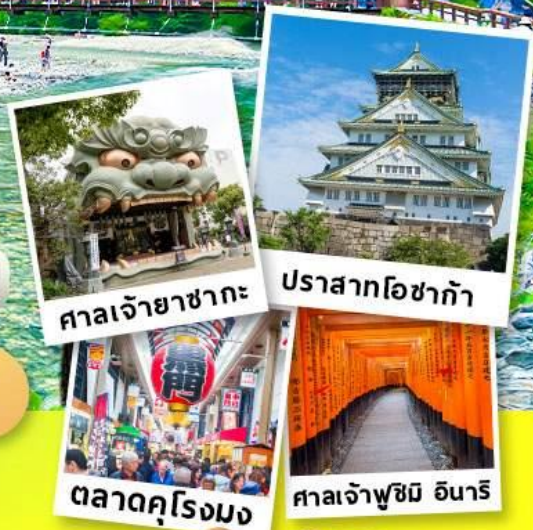
ศาลเจ้ายาซากะ