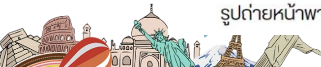
รูปถ่ายหน้าพาสปอร์ต