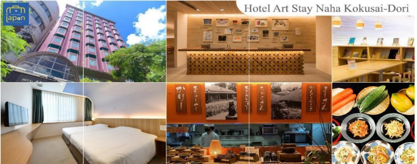
Hotel Art Stay Naha Kokusai-Dori

HOTEL ART STAY NAHA KOKUSAI-DORI หรือเทียบเท่า