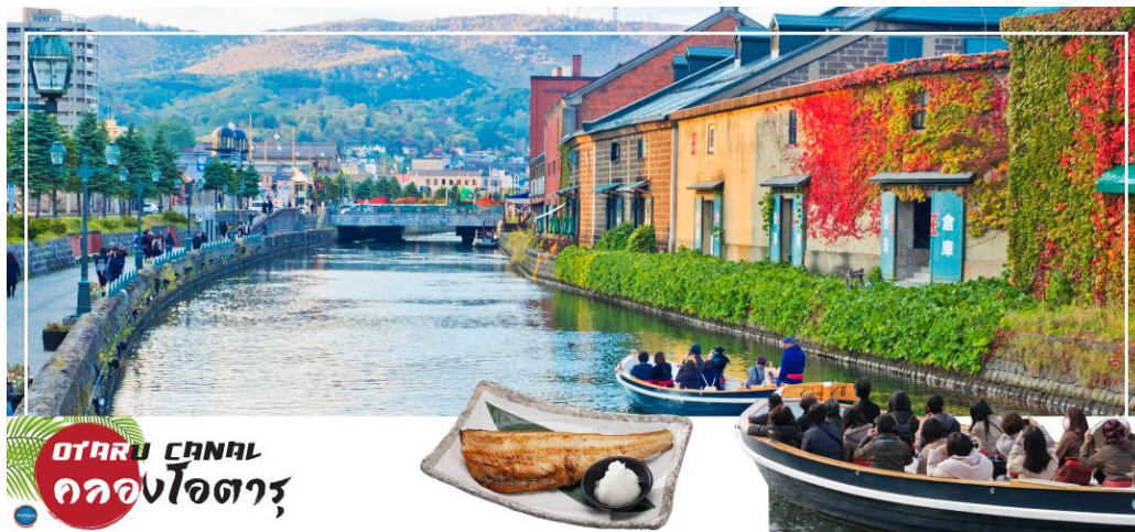
OTARU CANAL คลองโอตารุ

เมืองซัปโปโร – ดิวตี้ฟรี – เมืองโอตารุ – คลองโอตารุ – พิพิธภัณฑ์กล่องดนตรี – เมืองซัปโปโร – มหาวิทยาลัยฮอกไกโด – ถนนช้อปปิ้งทานุกิโคจิ