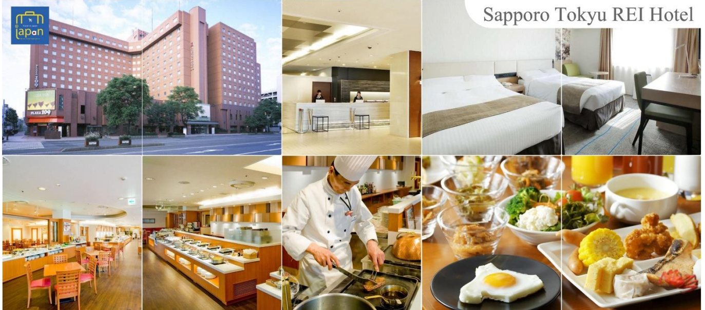
Sapporo Tokyu Rei Hotel

รับประทานอาหารเช้า ณ ภัตตาคาร (8) --- พิเศษ!!! เมนู ซาซึมิ + ซาซึมิ SAPPORO TOKYU REI HOTEL หรือเทียบเท่าระดับเดียวกัน