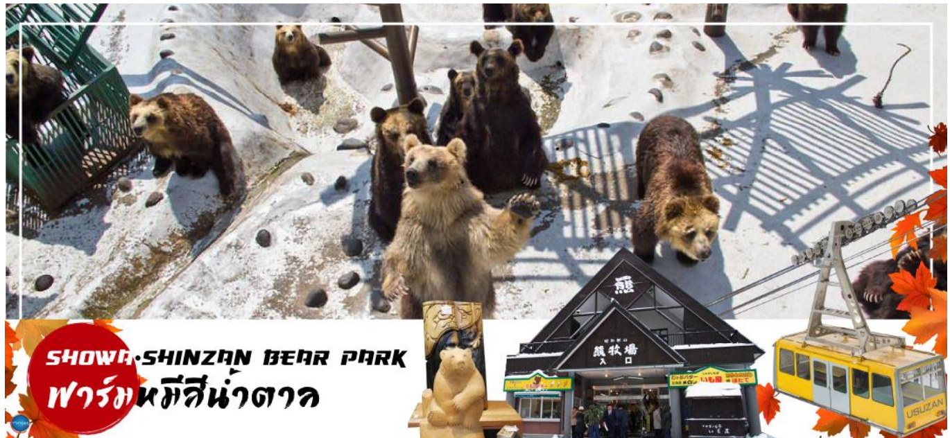
SHOWA-SHINZAN BEAR PARK พาร์คน้ำตาล

ทะเลสาบโทยะ – ภูเขาไฟโชวะ (นั่งกระเช้า) – ศูนย์อนุรักษ์พันธุ์หมีสีน้ำตาล – เมืองโจซังเค – ชมสะพานแขวนฟุตามิ ลีริบาชิ – สวนโจซังเคเกินเซน – เมืองซัปโปโร – ย่านซูซูกิโนะ