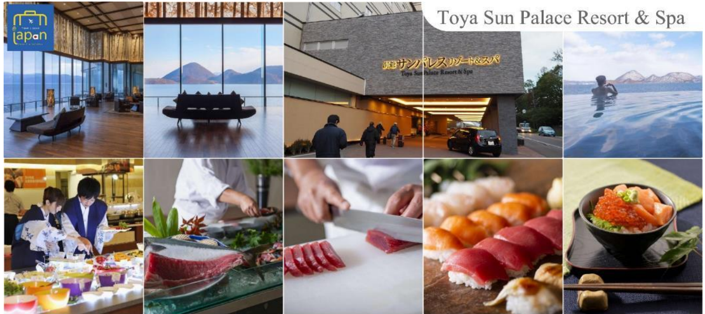
Toya Sun Palace Resort & Spa

TOYA SUN PALACE RESORT & SPA หรือเทียบเท่าระดับเดียวกัน