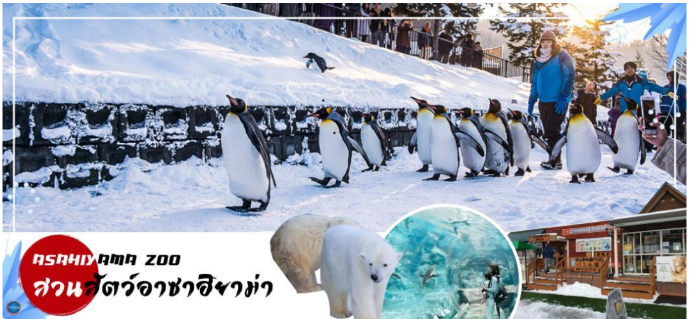
ASAHIYAMA ZOO สวนสัตว์อาซาฮิยาม่า

วันที่สาม เมืองอาซาฮิกาวา – สวนสัตว์อะซาฮิยาม่า – หมู่บ้านราเมงอะซาฮิยาม่า – เมืองฟูราโน่ – ลานสโนว์ เวิลด์ (กิจกรรมทางหิมะ) – เมืองซัปโปโร – ย่านซูซุกิโนะ