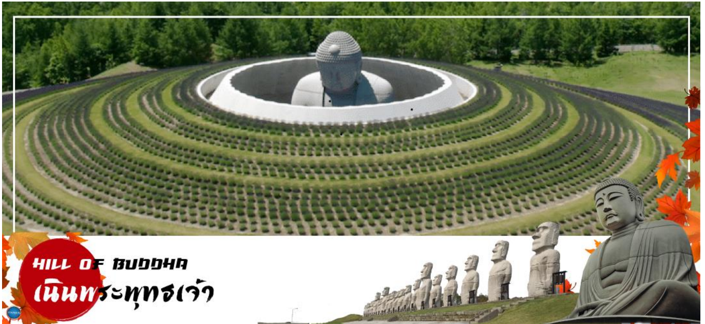
HILL OF BUDDHA เนินพระพุทธรเจ้า

วันที่สอง ท่าอากาศยานนิวซีโดสะะ สอกไกโด – เมืองซัปโปโร – เนินพระพุทธรเจ้า – เมืองฟูราโน – หมู่บ้านเทพนิยาย นิงเกิ้ลเทอเรส – เมืองอาซาฮิคาว่า – อีออน อาซาฮิคาว่า