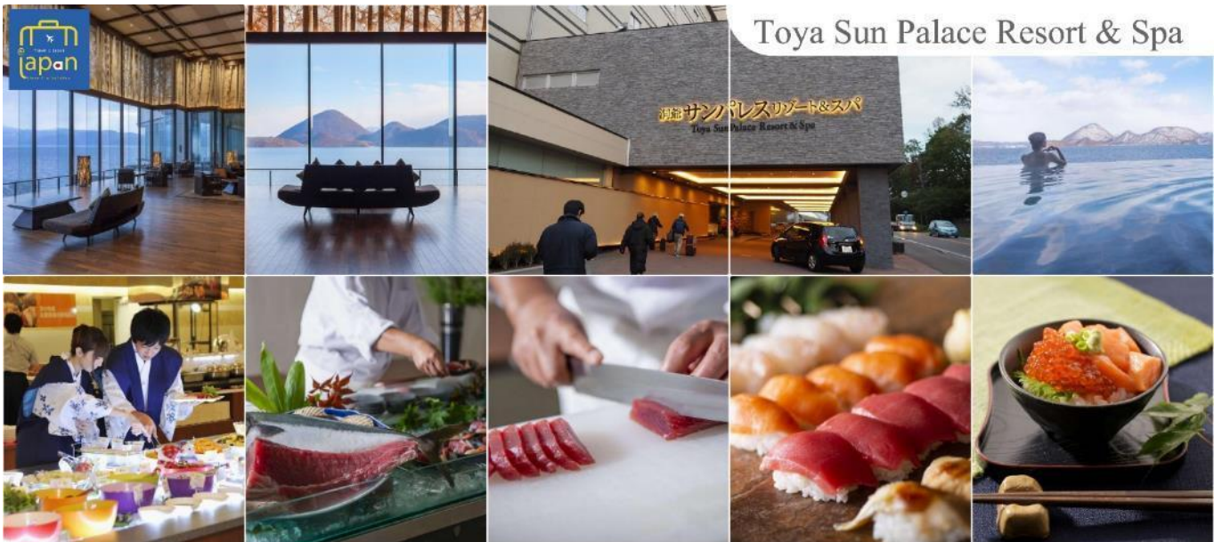
Toya Sun Palace Resort & Spa

ที่พัก TOYA SUN PALACE RESORT & SPA หรือเทียบเท่าระดับเดียวกัน