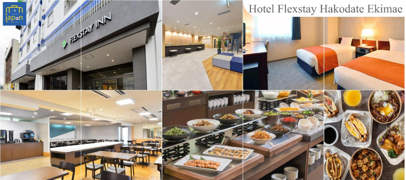
Hotel Flexstay Hakodate Ekimae

FLEX STAY INN HAKODATE EKIMAE หรือเทียบเท่าระดับเดียวกัน