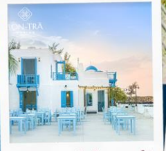
ซานตารีนาคาเฟ่