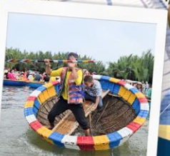
เรือกระดัง