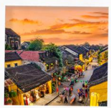
เมืองโบราณฮอยอัน