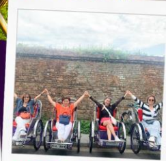
รถสามล้อ Cyclo