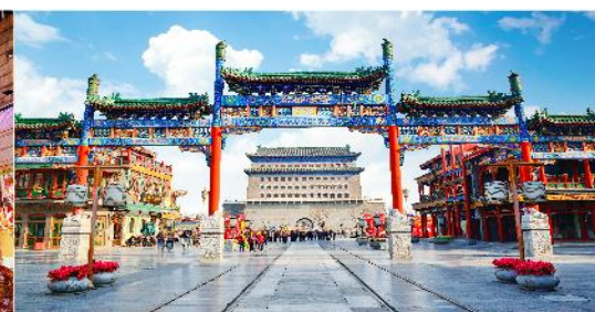
ถนนโบราณเจียนเหมิน

*ทางบริษัทฯ ขอสงวนสิทธิ์ในการสลับโปรแกรมทัวร์ตามความเหมาะสมขึ้นอยู่กับสถานการณ์หน้างาน โดยคำนึงถึงผลประโยชน์ของลูกค้าเป็นสำคัญ