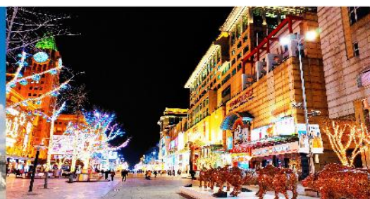
ถนนหวังฟู่จิ่ง