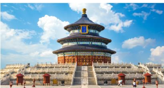
หอบูชาฟ้าเทียนถาน