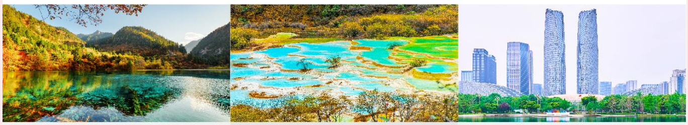
อุทยานแห่งชาติจื่อจ้ายโกว