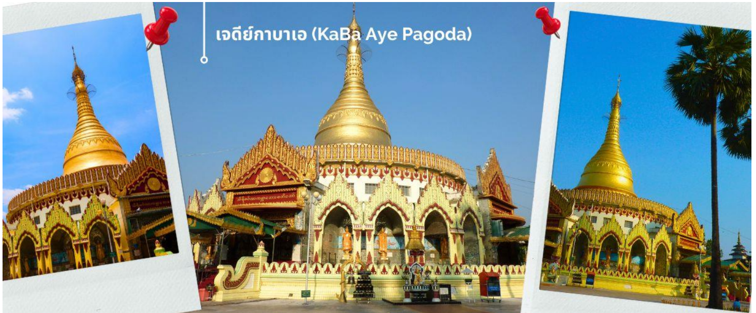
เจดีย์กาบาเอ (KaBa Aye Pagoda)

เป็นเจดีย์ทรงกลมครึ่ง ซึ่งมีส่วนเข้าทั้งหมดห้าด้านด้วยกัน นายอนุชาคนแรกของพม่า ได้สร้างขึ้นเพื่อใช้เป็นสถานที่ชำระพระไตรปิฎก สูง 34 เมตร สร้างขึ้นเมื่อปี 1952 เพื่อทำการสังคายนา พระไตรปิฎกครั้งที่ 6 เป็นเจดีย์ที่มีความสวยงามและแปลกตา ภายในบรรจุพระอัฐิธาตุของพระอัครสาวกแห่งองค์พระสัมมาสัมพุทธเจ้า คือพระโมคคัลลานะและพระสารีบุตร จะมีทางเข้าทั้งหมดห้าด้าน ทุกด้านมีพระพุทธรูปประดิษฐานอยู่บนฐานทักษิณ มีพระพุทธรูปหุ้มด้วยทองคำองค์เล็ก ๆ อีก 28 องค์ แทนอดีตสาวกของพระพุทธเจ้าทั้ง 28 องค์ ที่อุบัติขึ้นในโลกนี้ ส่วนพระพุทธรูปองค์พระประธานที่อยู่ข้างในหล่อด้วยเงินบริสุทธิ์มีน้ำหนัก กว่า 500 กิโลกรัม และ เข้าร่วมพิธีเทินพระธาตุเพื่อความป็นสิริมงคล