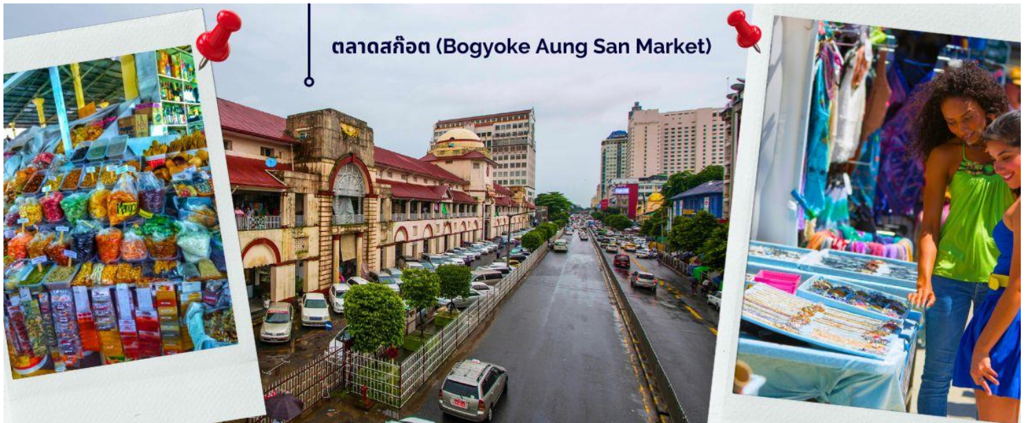
ตลาดสก๊อต (Bogyoke Aung San Market)

ให้ท่านได้มีเวลากับการเลือกซื้อของฝาก ของที่ระลึกต่างๆ ทั้งสินค้าพื้นเมืองที่มีชื่อเสียงของพม่าที่ ตลาดสก๊อต (Bogyoke Aung San Market) นี่คือนตลาดที่ใหญ่ที่สุดในย่างกุ้ง เป็นแหล่งช้อปปิ้งที่มีสินค้าวางขายแทบทุกชนิด เปรียบเสมือนตลาดนัดจตุจักรของบ้านเราก็คงได้ นอกจากสินค้าพื้นเมืองแล้ว ตลาดแห่งนี้ยังเป็นแหล่งรวมสินค้าประเภทอัญมณีที่เป็นที่รู้จักไปทั่วโลกนั่นคือ หยกพม่า (หากซื้อสินค้าหรืออัญมณีที่มีราคาสูงควรขอใบเสร็จรับเงินทุกครั้ง เนื่องจากจะต้องแสดงให้เห็นที่ศุลกากรหากมีการขอตรวจสอบ)