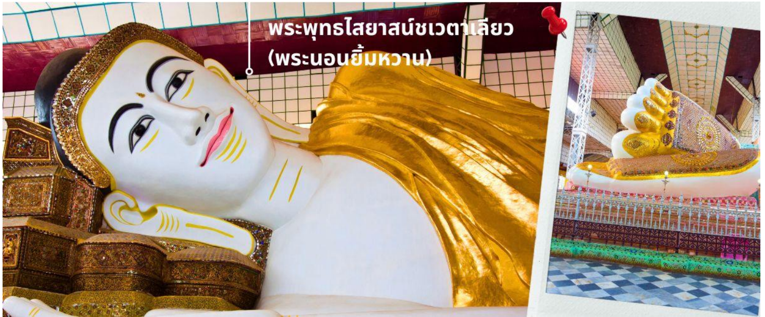
พระพุทธรไสยาสน์ชเวตาเลียว (พระนอนยิ้มหวาน)

ได้เวลาอันสมควร นำท่านเดินทางกลับสู่เมืองย่างกุ้ง