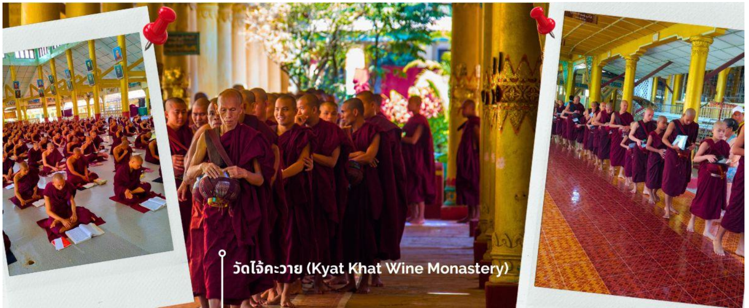
วัดใจ้คะวาย (Kyat Khat Wine Monastery)

เช้า รับประทานอาหารเช้า ที่ โรงแรม (3) นำท่านเดินทางลงจากพระธาตุนิรันธร์แขวน โดยใช้เส้นทางเดิม เพื่อมุ่งหน้าสู่เมืองหงสาวดี (ใช้เวลาเดินทางประมาณ 1 ชั่วโมง 30 นาที) เชิญร่วมทำบุญตักบาตรพระสงฆ์ ณ วัดใจ้คะวาย เมืองหงสาวดี มีพระสงฆ์กว่า 1000 รูป เป็นโรงเรียนสอนพระพุทธศาสนา นักรธรรมชั้นตรี โท และ เอก เพื่อศึกษาพระไตรปิฎกเป็นจำนวนมาก ในช่วงสายของทุกวัน พระสงฆ์และเณร จะเดินออกมาบิณฑบาตเพื่อเตรียมฉันเพล โดยวัดแห่งนี้ ได้รับการสนับสนุนจากชาวพุทธในพม่าเองและ นักท่องเที่ยวที่เดินทางมาที่วัด เพื่อทำการถวายเงินปัจจัย หรือ ข้าวสาร รวมไปถึง อุปกรณ์การเรียนและเครื่องเขียนต่างๆ เพื่อใช้ในการ ศึกษาธรรมะของพระสงฆ์และเณรในวัดใจ้คะวายแห่งนี้