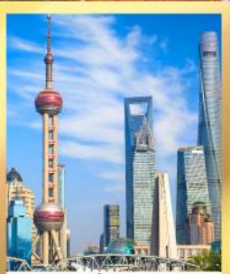
เซี่ยงไฮ้