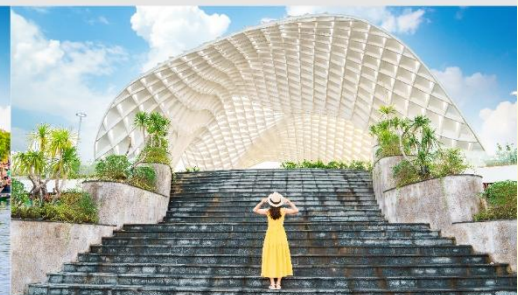
สวนเอเปค

*กรณีห้องพัkbานาฮิลล์เต็ม ขอสงวนสิทธิ์ในการเปลี่ยนวันเข้าพัก และปรับเปลี่ยนโปรแกรมโดยคำนึงถึงผลประโยชน์ลูกค้าเป็นสำคัญ