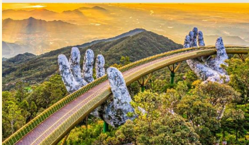
บานาฮิลล์