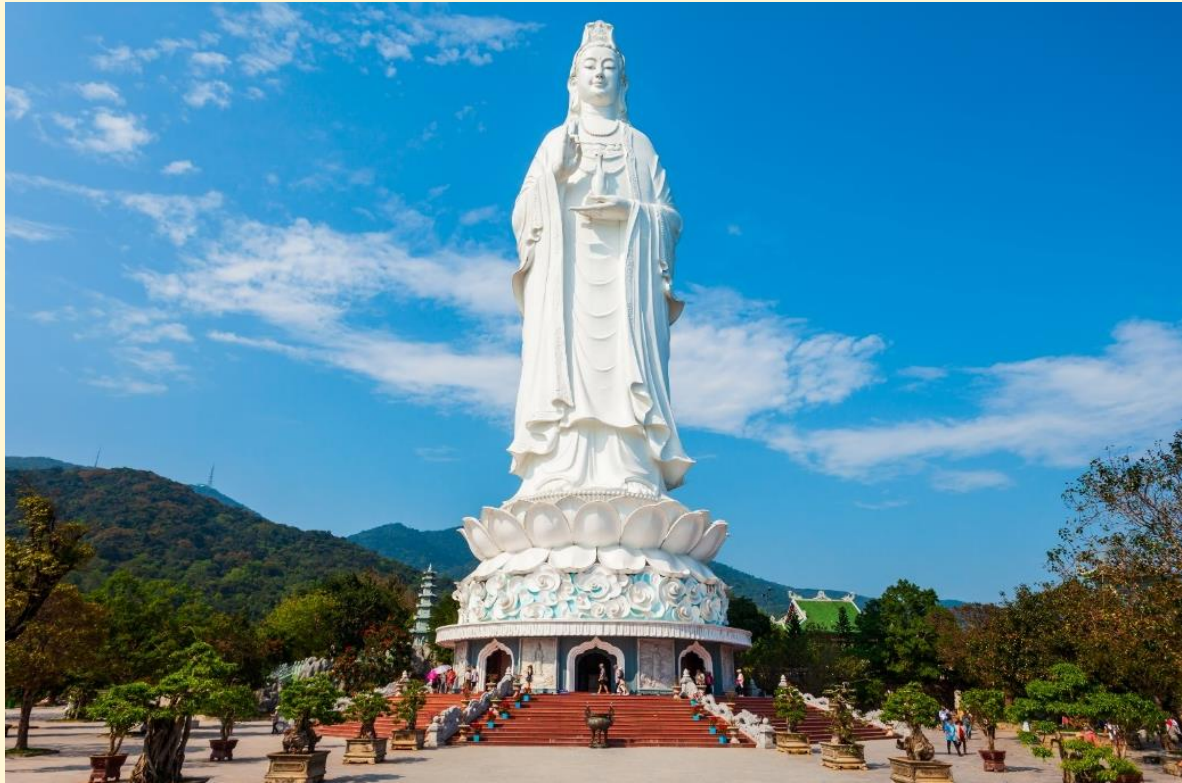
หน้าท่าน

แวะชม Marina Café คาเฟ่ริมทะเล สไตล์ซานโตรินี่ในเมืองดานัง เพลิดเพลินกับบรรยากาศสุดฟินกับ