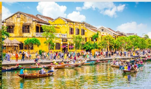
เมืองโบราณฮอยอัน