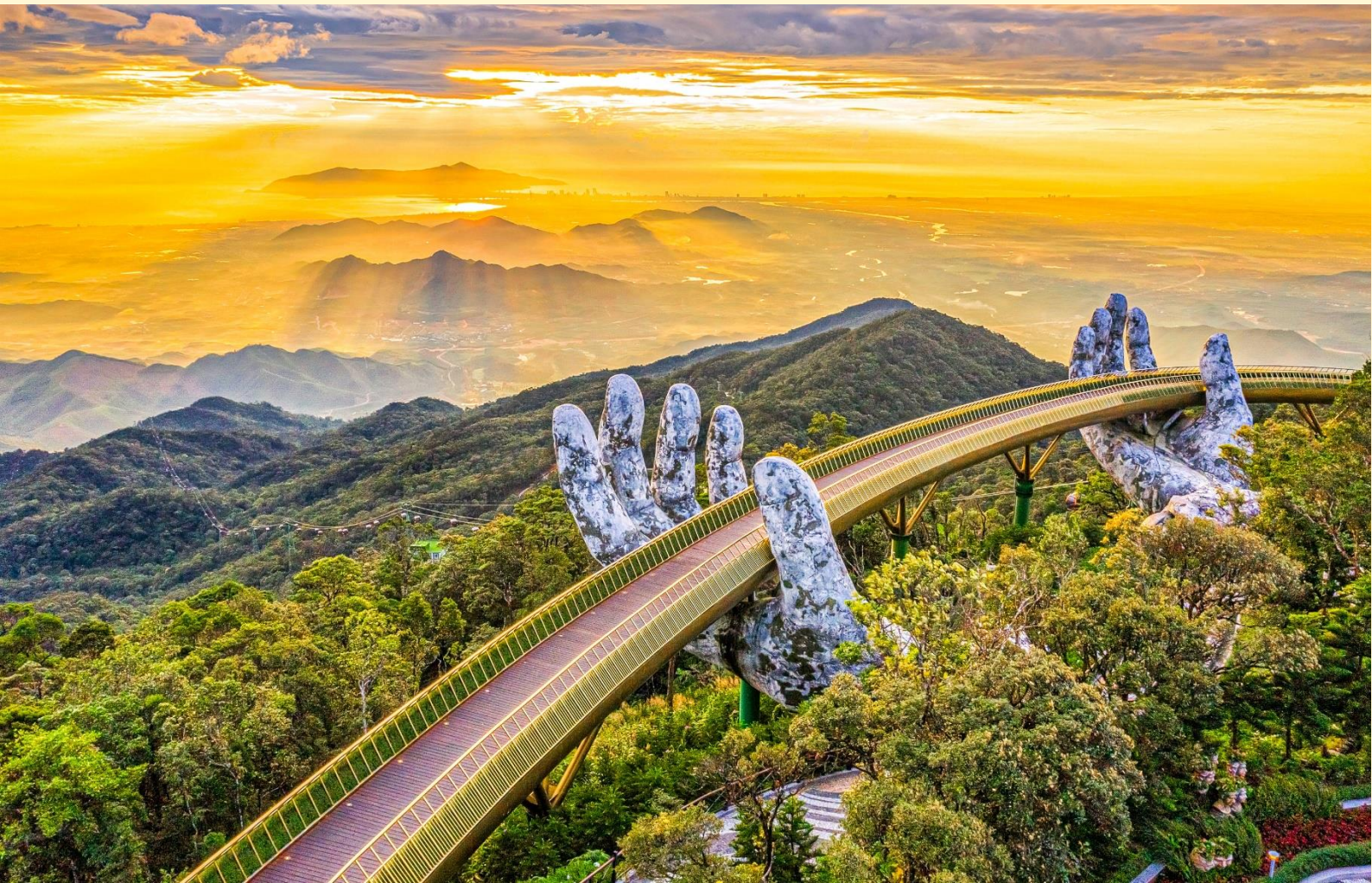
บานาฮิลล์

อิสระให้ท่านเดินชม สะพานโกเด้นบริดจ์ (Golden Bridge) เป็นสถานที่ท่องเที่ยวที่เพิ่งเปิดให้นักท่องเที่ยวได้เที่ยวชมได้ไม่นานมานี้ มีความสูงจากระดับน้ำทะเล 1,400 เมตร ความยาว 150 เมตร โคนึงไปตามแนวเขา จุดเด่นคือสะพานถูกทอดผ่านอุ้งมือหินขนาดยักษ์สองมือ ผู้ออกแบบจะทำให้รู้สึกราวกับว่ากำลังเดินอยู่บนเส้นด้ายสีทองที่ทอดอยู่ในหัตถ์ของเทพ อิสระให้ท่านได้ถ่ายภาพและชมวิวทิวทัศน์ กรณีนอนพักบนบานาฮิลล์มีกระเช้ารอบเช้าพิเศษสำหรับลูกค้าที่พักบนบานาฮิลล์ เปิดให้ท่านได้ไปชมสะพานมือแบบ Exclusive จากนั้นได้เวลาอันสมควรนำท่านนั่งกระเช้าลงจาก