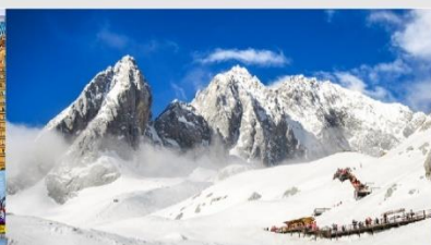
ภูเขาหิมะมิงกรหยก