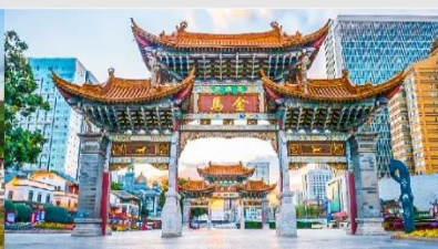
ประตูม้าทอง ไถ่หยก