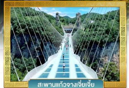
สะพานแก้วจางเจียเจี๋ย

เดินทางโดย: สายการบินเวียดนามแอร์ไลน์ (VZ)