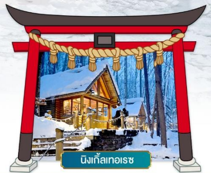
นิงเกิลเทอเรซ