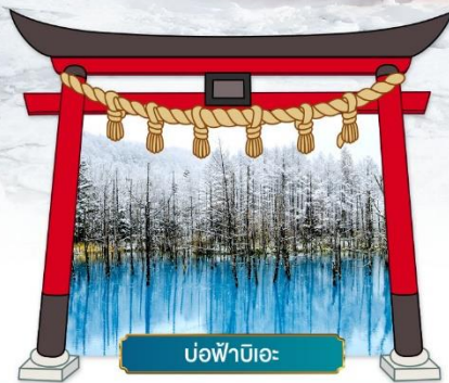
บ่อน้ำสาโอะ

☑ ชมความสวยงามท่ามกลางหิมะ ณ หมู่บ้านเทพนิยาย นิงเกิลเทอเรซ