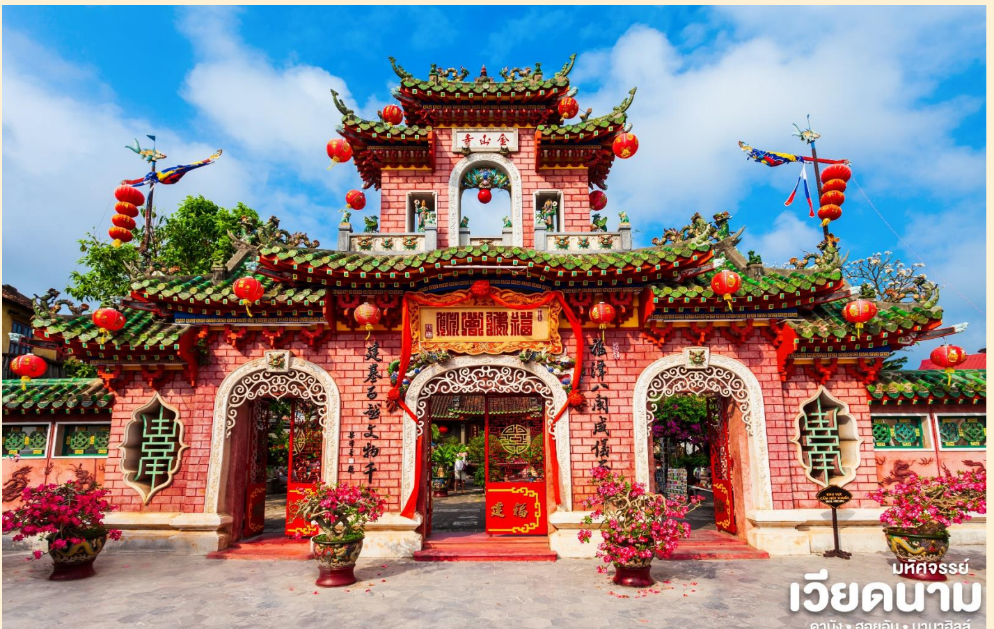
บทวิจารณ์ เวียดนาม ดานัง • ฮอยอัน • บานาฮิลล์

นำท่านชม วัดจีน เป็นสมาคมชาวจีนที่ใหญ่และเก่าแก่ที่สุดของเมืองฮอยอันใช้เป็นที่พบปะของคนหลายรุ่น วัดนี้มีจุดเด่นอยู่ทำงานไม้แกะสลักกลดลายสวยงามท่าน สามารถทำบุญต่ออายุโดยพิธีสมัยโบราณ คือ การนำรูปที่ขีดเป็นกันหอย มาจุดทิ้งไว้เพื่อ เป็นสิริมงคลแก่ท่าน