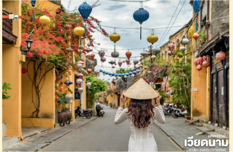
บทวิจารณ์ เวียดนาม ดานัง • ฮอยอัน • บานาฮิลล์

นำท่านเดินทางสู่ “เมืองโบราณฮอยอัน” เมืองฮอยอันนั้นอดีตเคยเป็นเมืองท่า การค้าที่สำคัญแห่งหนึ่งในเอเชียตะวันออกเฉียงใต้และเป็นศูนย์กลางของการ แลกเปลี่ยนวัฒนธรรมระหว่างตะวันตกกับตะวันออกองค์การยูเนสโกได้ประกาศให้ฮอยอันเป็นเมืองมรดกโลกทางวัฒนธรรมเนื่องจากเป็นสถานที่สำคัญทางประวัติศาสตร์ แม้ว่าจะผ่านการบูรณะขึ้นเรื่อยๆ แต่ก็ยังคงรูปแบบของเมืองฮอยอันไว้ได้