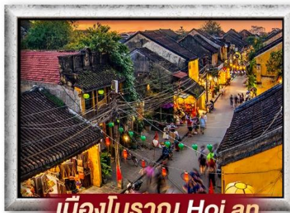
เมืองโบราณ Hoi an