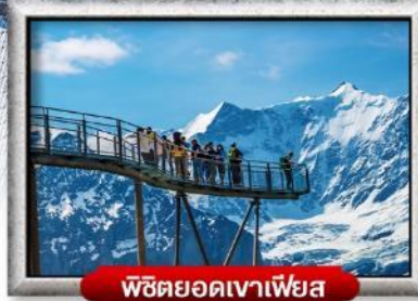
พิษียอดเขาเพียส