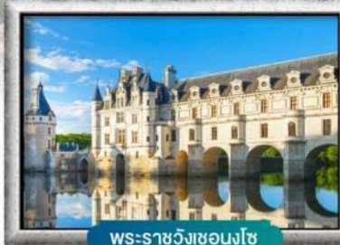
พระราชวังชองงโซ