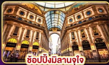
ช้อปปิ้งมิลานจุใจ

📅 เดินทาง : 9-16 ก.พ. / 9-16 มี.ค. / 23-30 มี.ค. 68