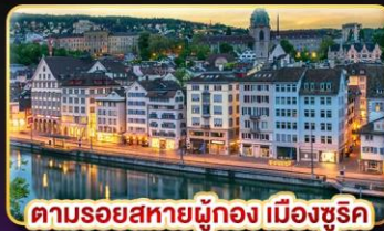
ตามรอยสายน้ำของ เมืองซูริค