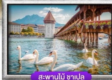
สะพานไม้ชาเปลา