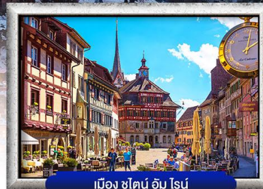
เมือง ชไตน์ อัม ไสน์