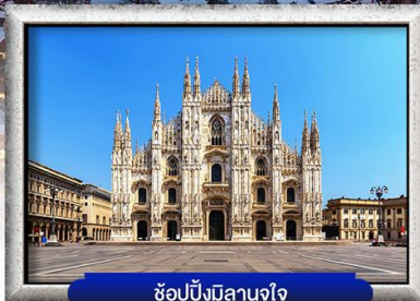
ซอปปิงมีลานจุใจ