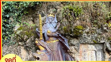
จุดที่ 1 เทพเจ้าไฉซิงเอี้ย หรือ เทพเจ้าแห่งโชคลาภ