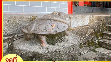
จุดที่ 2 รูปปั้นงูพันเต่าข้าง ศาลเจ้าพ่อเสือ