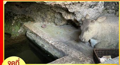
จุดที่ 3 บ่อน้ำศักดิ์สิทธิ์วัดกตัญญู