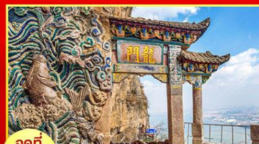
จุดที่ 5 ชุมประตุมังกร

กลางวัน ๑๐ บริการอาหารกลางวัน ณ ภัตตาคาร