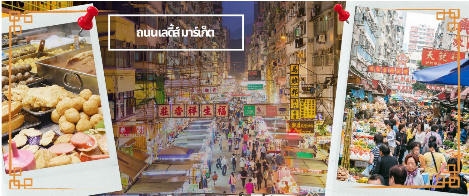
ถนนเลดี้ มาร์เก็ต

สมควรแก่เวลานำคณะออกเดินทางสู่สนามบินฮ่องกง