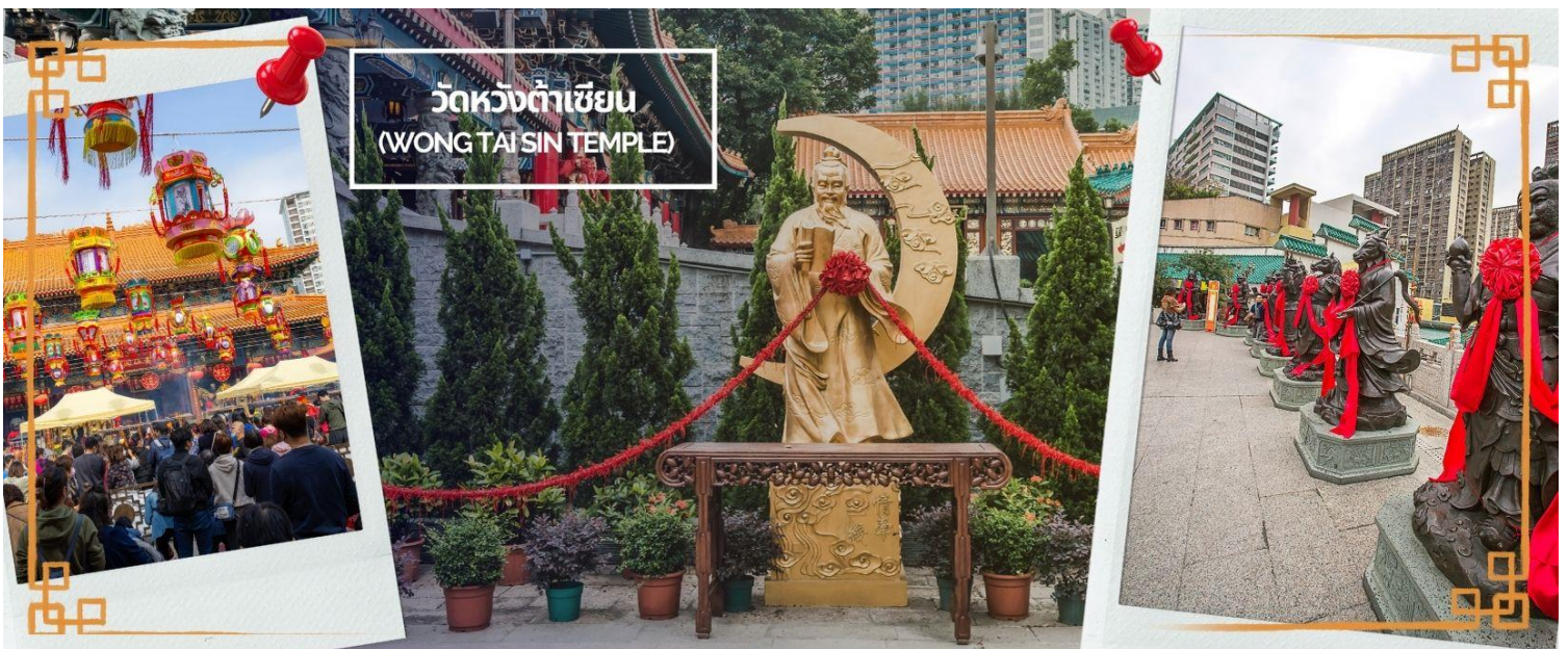
ผูกด้ายดวงชะตา ระหว่างคู่รักซึ่งเมื่อคู่กันแล้วก็จะไม่แคล้วคลาดกัน

และยังถ่ายทอดวิชาให้กับลูกศิษย์มากมาย จนได้รับยกย่องว่าเป็นเทพหว่องไท่ซิน และได้ตั้งศาลหว่องไท่ซิน เอาไว้ เพื่อกราบสักการะ นอกจากนั้นแล้ว ภายในวัดยังมี เทพเจ้าด้ายแดง หรือเทพเจ้าหยุกโหลว รูปปั้นสีทอง มี ลี้วพระจันทร์อยู่ด้านหลัง เป้าหมายของคนโสดอยากมีคู่!! โดยการขอพรกับเทพเจ้าองค์นี้ต้องใช้ด้ายแดง ผูกนิ้วเอาไว้ไม่ให้หลุดระหว่างพิธี เพราะชาวจีนเชื่อว่าด้ายแดงนี้แหละคือ เส้นโยงโชคชะตาด้านความรัก คนโสด ก็เป็นการขอพรให้เจอเนื้อคู่ ส่วนคนมีคู่ ก็จะช่วยทำให้มีความรักที่มั่นคงและยืนยาว เมื่อไปถึงจะเห็นรูปปั้นของ เทพหยุกโหลวอยู่ตรงกลาง เมื่อหันหน้าเข้าหาเทพหยุกโหลว จะพบรูปปั้นเจ้าบ่าว อยู่ทางขวา และรูปปั้นเจ้าสาว อยู่ทางซ้าย โดยมีด้ายแดงผูกโยงจากเจ้าบ่าวและเจ้าสาวมาที่เทพหยุกโหลว ซึ่งท่านจะคอยทำหน้าที่จัดรายชื่อ คู่รัก เชื่อกันว่าสมุดที่ผู้เฒ่าถือในมือ คือบัญชีรายชื่อคู่รักที่จะได้รับคำอวยพรให้อยู่คู่กันอย่างร่มเย็นเป็นสุข ซึ่งจะ ปราบกฏด้วยคมคำคืนภายใต้แสงจันทร์ เป็นเทพเจ้าผู้เป็นอมตะที่อาศัยอยู่บนดวงจันทร์ และลงมาโลกมนุษย์เพื่อ