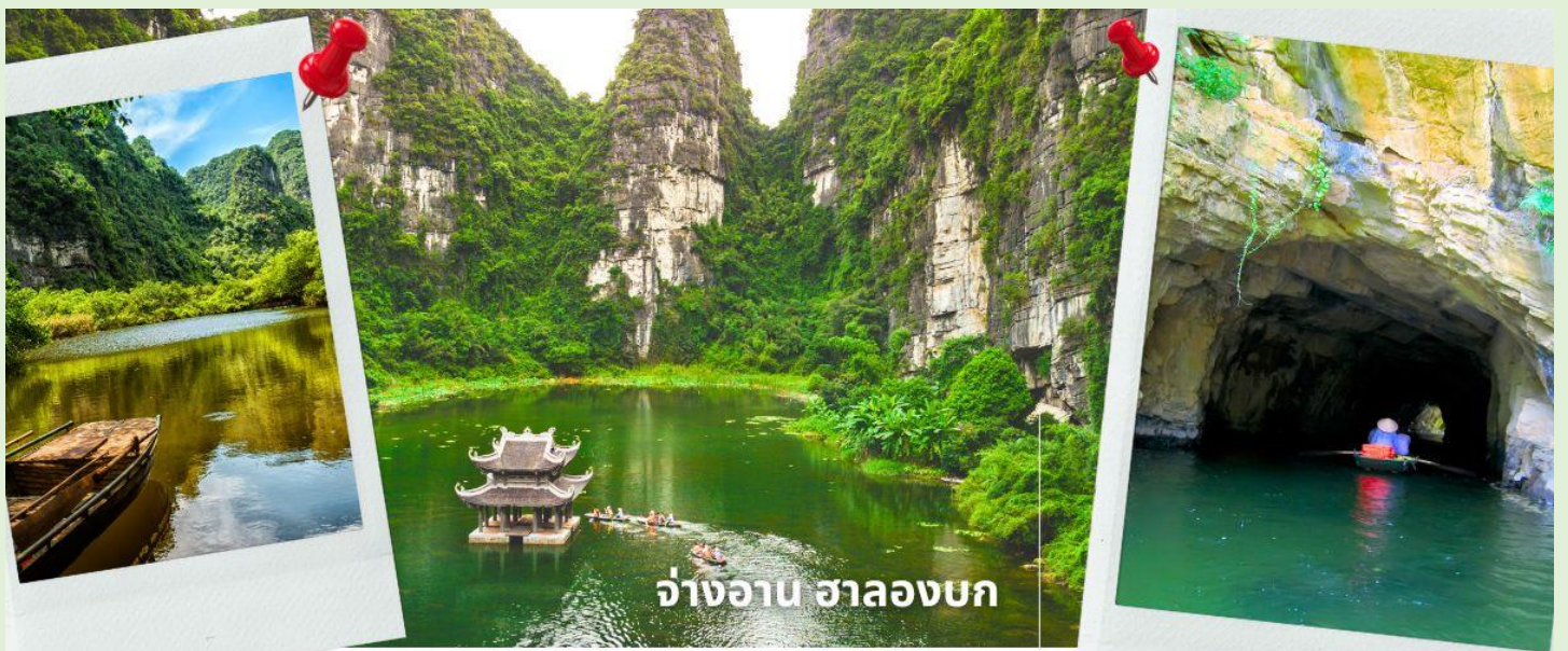
จ่างอาน ฮาลองบก

จากนั้นนำท่านเดินทางสู่ จ่างอาน เป็นพื้นที่ที่มีทัศนียภาพอันงดงามของยอดเขาหินปูน แม่น้ำหลายสาย ไหลลัดเลาะ บางส่วนจมอยู่ใต้น้ำ และยังถูกล้อมรอบด้วยผาสูงชัน จึงทำให้สถานที่แห่งหนึ่งงดงามน่าชม การขึ้นชมทัศนียภาพที่สวยงามในจ่างอานนั้น คือการล่องเรือเล็กประมาณลำละ 4-5 คนเพื่อเข้าไปเยี่ยมชมจ่างอาน เรือแจวกี้จะพาเราไปเยี่ยมชมวัด หลังจากนั้นก็จะพาเราไปลอดถ้ำ มีทั้งหมด 49 ถ้ำ ซึ่งแต่ละถ้ำจะมีชื่อแตกต่างกันไปจะใช้เวลาล่องเรือไปกลับร่วมสองชั่วโมงเลย ที่เดียว จ่างอานยังถูกเรียกว่า ฮาลองบก เพราะที่นี่มีเขาหินปูนและถ้ำคล้ายกับที่อ่าวฮาลอง