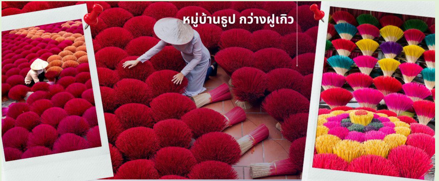
หมู่บ้านรูป กว้างฝูเกิว

จากนั้นนำท่านเดินทางสู่เมืองนิงห์บิงก์ และเที่ยวชมวิถีของชาวเวียดนามใน หมู่บ้านรูป หมู่บ้านชุมชนที่เป็นแหล่งผลิตรูปที่ใหญ่ที่สุดแห่งหนึ่งของประเทศเวียดนาม หมู่บ้านกว้างฝูเกิว หมู่บ้านรูป เอกลักษณ์ เหมือนทุ่งดอกไม้ใกล้กรุงฮานอย ชาวบ้านที่ส่งต่อ และถ่ายทอดวิธีการทำรูปแบบดั้งเดิม ทั้งการเหลาไม้ไผ่ ย้อมสี ตากแดด และมัดลักษณะคล้ายพุ่มไม้ หรือ ดอกไม้ เอกลักษณ์นี้ถูกพัฒนาและต่อยอด จัดแต่งรูปให้