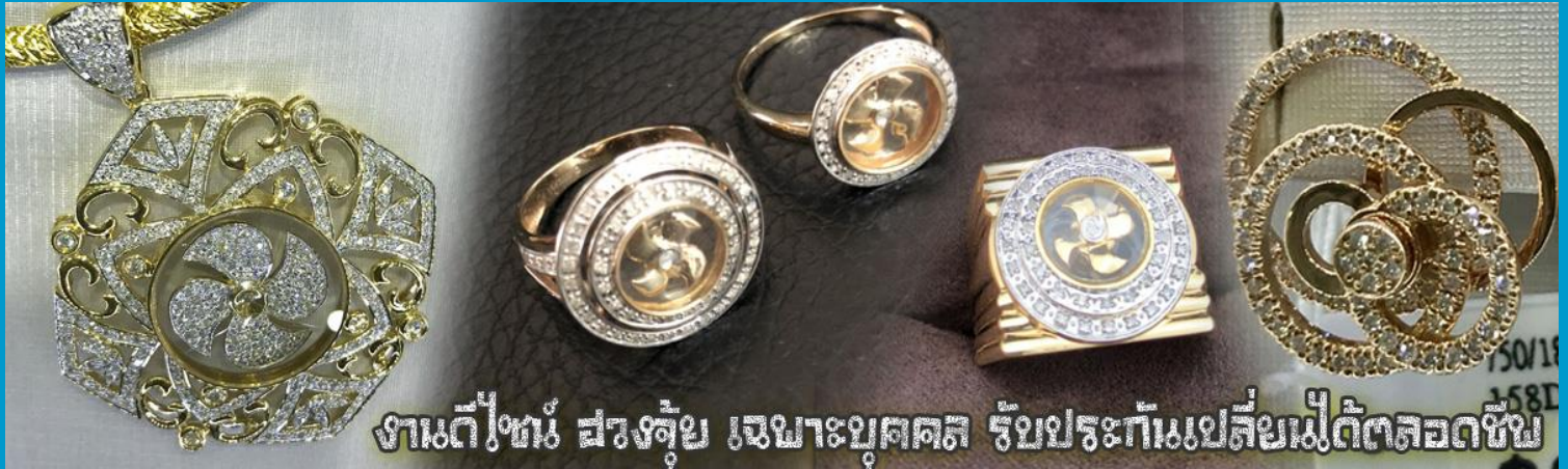
งานดีไซน์ สวยจุ้ย เฉพาะบุคคล รับประกันเปลี่ยนไม่ได้ตลอดชีพ

นำท่านเยี่ยมชม โรงงานจิวเวลรี่ ที่ขึ้นชื่อของฮ่องกงพบกับงานดีไซน์ที่ได้รับรางวัลอันดับยอดเยี่ยม และใช้ในการเสริมดวงเรื่อง ฮวงจุ้ยนำความโชคดี มั่งคั่งแก่ผู้สวมใส่ ซึ่งในเมืองไทยก็ได้นิยมแพร่หลายออกไป ไม่ว่าจะเป็นกลุ่ม ดารา นักการเมือง พ่อค้าแม่ขายที่ประกอบธุรกิจ เจ้าของกิจการห้างร้านต่าง ๆ ซึ่งเชื่อกันว่าจะนำสิ่งดี ๆ ปิดเป่าสิ่งชั่วร้ายให้กับบุคคลที่สวมใส่ ซึ่งจะมีมากมายหลายชนิด เช่นจี้กั๊งกัน แหวนรุ่นต่าง ๆ นาฬิกาข้อมือ (ซึ่งผู้สวมใส่จะได้รับการดูลายมือจากซินเซปประจำร้าน เพื่อนำวิธีการเสริมดวงในการสวมใส่โดยไม่ได้ติดค่าบริการ)