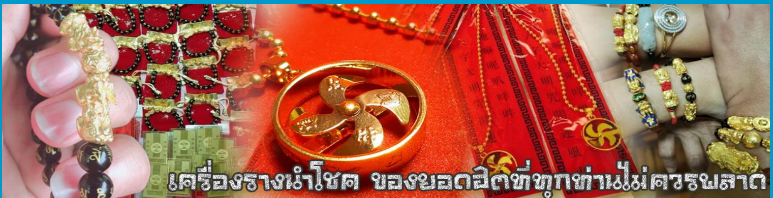
เครื่องรางนำโชค ของขลังดีที่ทุกท่านไม่ควรพลาด

จากนั้นนำท่านสู่ ร้านหยก ชมความงามปีเซียะ ที่เชื่อกันว่าเป็นวัตถุมงคลยอดนิยม ที่มีการนำมาบูชา เพื่อให้ช่วยป้องกันสิ่งชั่วร้าย เรียกทรัพย์สินเงินทองให้ไหลมาเทมา และกักเก็บทรัพย์นั้นไม่ให้รั่วไหลออกไปไหนได้ ชาวจีนโบราณเชื่อกันว่า ปีเซียะเป็นสัตว์ประหลาดที่รวมลักษณะของสัตว์มงคลทั้ง 5 ชนิดไว้ด้วยกัน ได้แก่ มังกร พญาราชสีห์หรือสิงโต, อินทรี, กวาง, และแมว โดยตามตำนานเล่าว่า ปีเซียะเป็นลูกมังกรตัวที่ 9 (เทพแห่งโชคลาภ) ของพญามังกรสวรรค์ มีชื่อเรียกด้วยกันหลายชื่อไม่ว่าจะเป็น “เทียนลก (กวางสวรรค์)” เป็นชื่อเดิม ส่วนจีนกวางตุ้งจะเรียกว่า “เผ่เฮ่า” และคนจีนแต้จิ๋วจะเรียกว่า “ผีซิว”