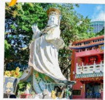
เจ้าแม่กวนอิมธิพลัสเบย์

23 กุมภาพันธ์ 2568 วันยืมเงินเจ้าแม่กวนอิม วัดฮ่องกง