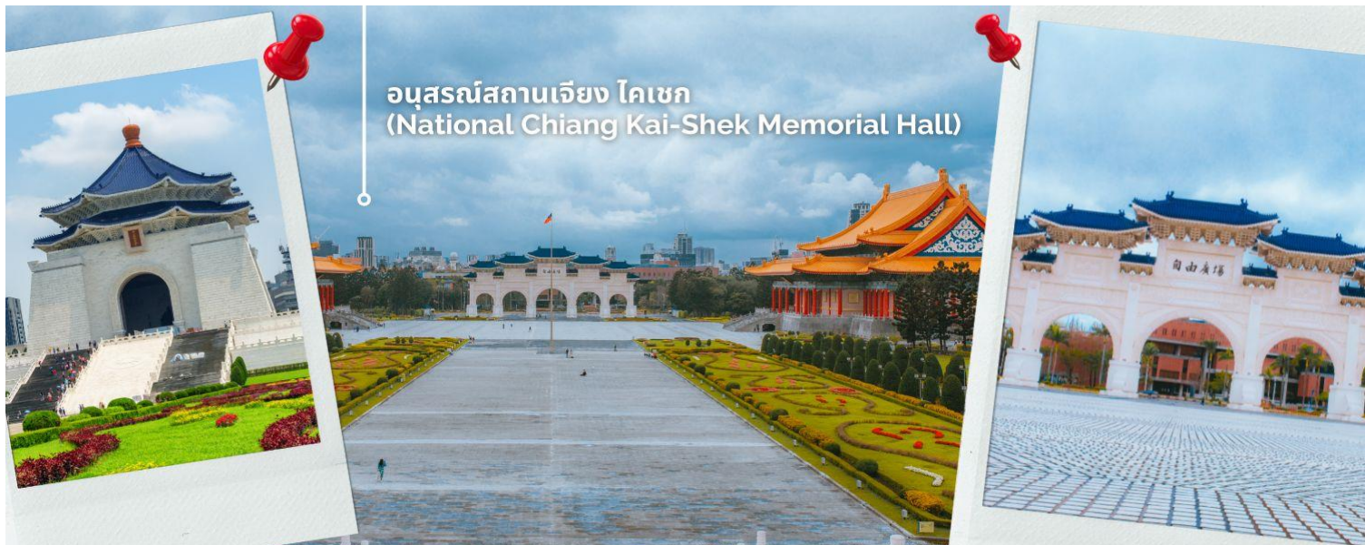
อนุสรณ์สถานเจียง ไคเชก (National Chiang Kai-Shek Memorial Hall)

ถูกสร้างขึ้นตามแบบสถาปัตยกรรมจีนโบราณ บันไดทั้งสี่ด้านถูกสร้างด้วยหินอ่อนสีขาวเป็นขั้นตามแบบ พีระมิดอียิปต์ หลังคาสีน้ำเงิน รวมทั้งยังมีสวนดอกไม้สีแดง ที่เป็นการแสดงออกทางสัญลักษณ์ให้เห็นถึง อิสรภาพ ความเท่าเทียม และความเป็นหนึ่งเดียวกัน ตามลี้ของธงชาติไต้หวัน