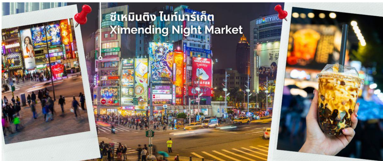
ซีเหมินติง ไนท์มาร์เก็ต Ximending Night Market

คำ อิสระอาหารค่ำ เพื่อให้ทุกท่านเต็มที่กับการช้อปปิ้งซึ่งไคด์จะแนะนำร้านอาหารร้านเด็ดร้านอร่อยให้