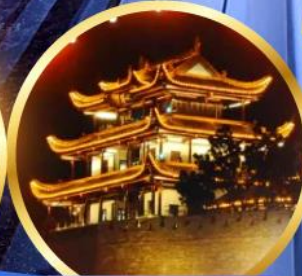
หอคอยทองคำทึบหมื่นชัน