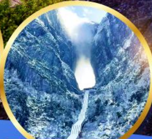
ประตูสวรรค์ เขาทึบหมื่นชัน