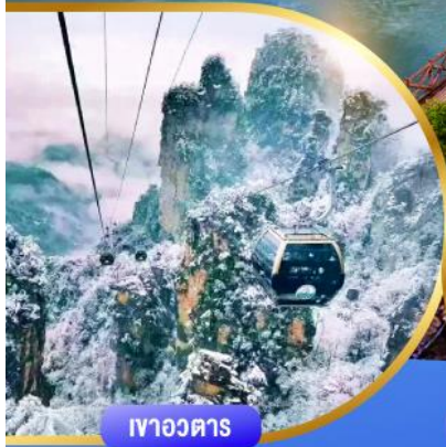
เทาอวดาร