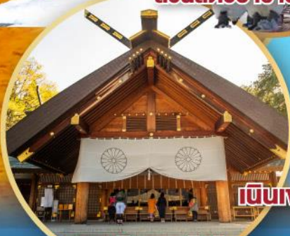
เป็นเจ้าแห่งพระพุทธรเจ้า