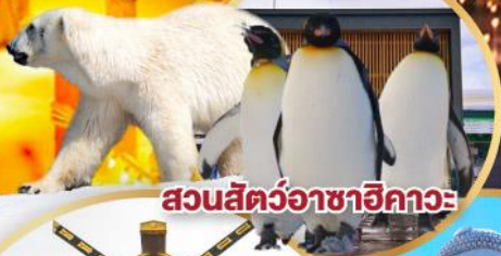
สวนสัตว์อาซาฮิกาวะ