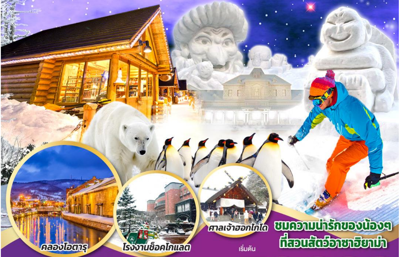
คลองโอตารุ