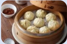
เที่ยง บริการอาหารกลางวัน ณ ภัตตาคาร เมนูพิเศษ!! เสี่ยวหลงเปา (5)

นำท่านนมัสการ วัดหลงซาน (Longshan Temple) เป็นวัดที่เก่าแก่และมีชื่อเสียงของคนไต้หวัน วัดแห่งนี้มีอายุราวๆ เกือบ 300 ปี ด้านหน้าตกแต่งด้วยเสามังกรทั้งชายและขวา เปรียบเสมือนกำลังปกป้องห้องโถงกลาง ในปี ค.ศ. 1740 เกิดความเสียหายครั้งใหญ่ทางวัดจึงได้รับการบูรณะหลายครั้ง ทั้งบานประตู คาน หลังคา และเสามังกรแกะสลักตระหง่านสวยงาม เป็นประติมากรรมที่มีความละเอียดอ่อนเป็นงานไม้ที่สวยงาม มีหนังสือจีนโบราณประดับตรงทางเข้าให้ความสัมผัสของวรรณกรรมนอกเหนือจากคุณค่าทางศรียังส่งเสริมการท่องเที่ยวอีกด้วย ปัจจุบันเป็นที่นิยมมาขอพรเรื่องการทำงาน การเรียน ที่สำคัญเรื่องความรัก เชื่อกันว่าใครที่ไม่ประสบความสำเร็จเรื่องความรัก ให้ขอพรกับเทพเจ้าจันทราที่วัดแห่งนี้ แล้วความรักจะกลับมาดีขึ้น