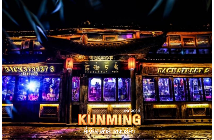
มทกอสย์ KUNMING ลี่เจียง คำลี่ แซงกรี่ล่า