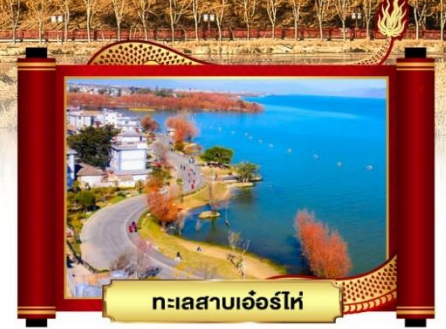
ทะเลสาบเอ๋อร์ไท่