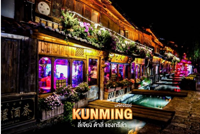
มทกอสย์ KUNMING ลี่เจียง คำลี่ แซงกรี่ล่า