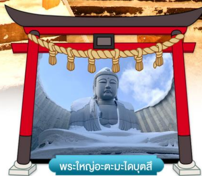
พระใหญ่อะตะมะไดบุตสึ