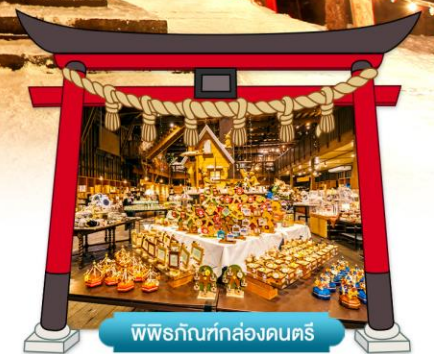
พิพิธภัณฑ์กล่องดนตรี