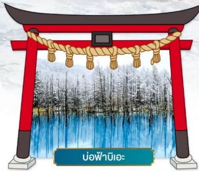
บ่อน้ำบิเอะ

ชมความสวยงามท่ามกลางหิมะ ณ หมู่บ้านเทพนิยาย นิงเกิลเทอเรซ