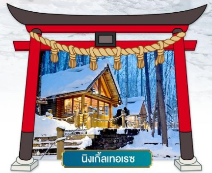
นิงเกิลเทอเรซ