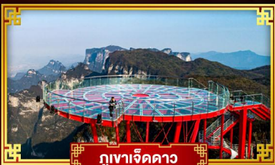
กูเงาเจ็ดดาว