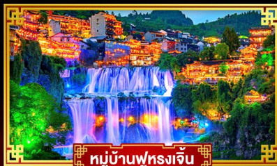
หมู่บ้านฟุรงเจิ้น