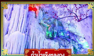
ถ้าบ้านเจียงหนง

สุดอลังการ น้ำตก 2 พรมแดน แหล่งท่องเที่ยวระดับ 5A