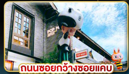
ถนนชอยกวางชอยแคบ