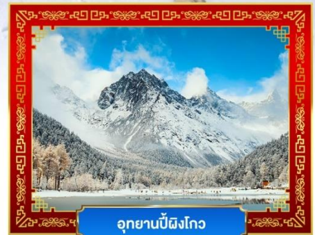
อุทยานปี้ผิงโกว