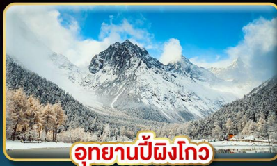
อุทยานปี้ผิงโกว