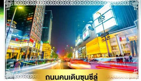
ถนนคนเดินชุนซีลู่