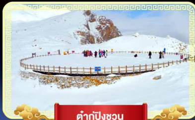
ต้ากู่ปิงชว่น