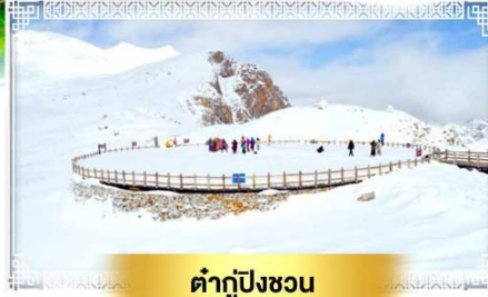
ต่ากู่ปิงชวอน