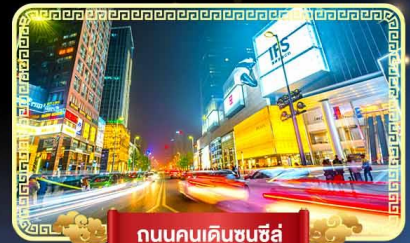
ถนนคนเดินชุนชี่ลู่