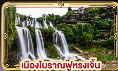
เมืองโบราณฟุรงเจิน