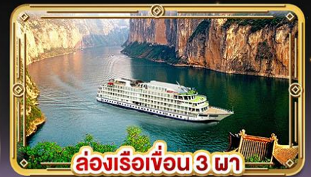
ล่องเรือเขื่อน 3 ผา