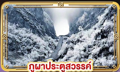
กวนผาประตูสวรรค์